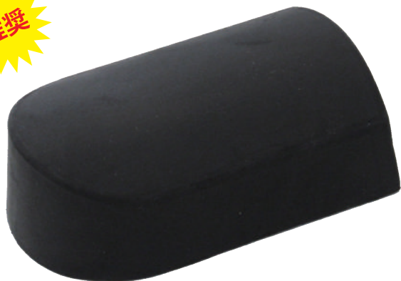
ND-3 ヒール大ゴム当て盤