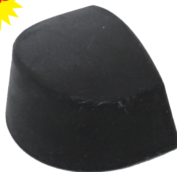
ND-2 ヒール小ゴム当て盤